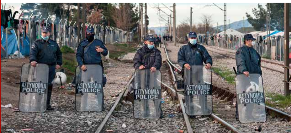
Griechische Polizisten bewachen einen Eingang im Flüchtlingslager in Idomeni nahe der mazedonischen Grenze

Das Bestreben der EU-Staaten ist es, möglichst wenige Flüchtlinge an den Küsten der EU-Staaten ankommen zu lassen. Sie sollen in internationalen Gewässern oder idealerweise bereits vor den Küsten der anderen Anrainerstaaten abgefangen werden. Dieses Anliegen führte unweigerlich zur Militarisierung. Den meisten regulären Booten und Schiffen der Küstenwachen fehlt es sowohl an der notwendigen Reichweite und Stehzeit auf See für solche Einsätze als auch an der leistungsfähigeren Ausstattung der Kriegsschiffe im Bereich der Aufklärung und Überwachung.