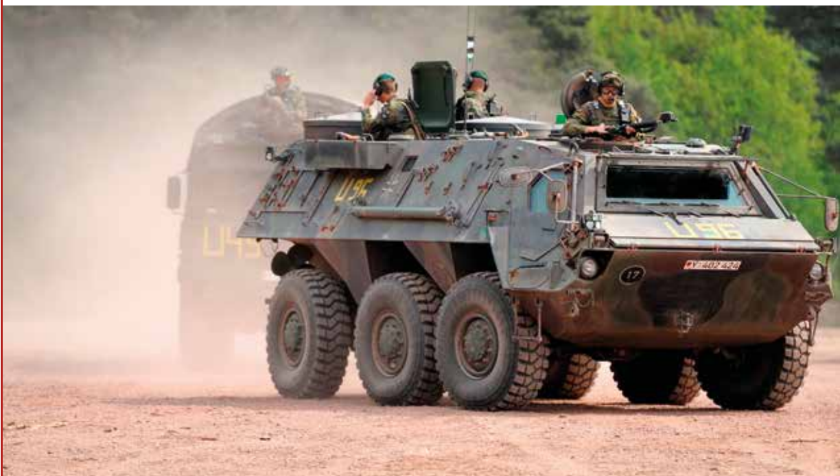
Ein Radpanzer des Typs Fuchs 2, wie er auch von dem Unternehmen Rheinmetall Defence nach Algerien geliefert wurde

Der deutsch-französisch-spanische Rüstungsriese Airbus SE galt bis zum Verkauf der Saparte Airbus Defense & Security (Airbus DS) an die US-Investmentgesellschaft KKR im Jahr 2018 als Big Player im Grenzschutzmarkt. Parallel zum Anstieg der Fluchtbewegungen nach Europa kündigte Bernhard Grewert, Vorstandsvorsitzender der damaligen EADS-Tochter Cassidian im Dezember 2012 eine Reorganisation der Geschäftstätigkeiten an: »Wir werden unser Verteidigungsgeschäft stabilisieren und verstärkt in ausgewählte Sicherheitssegmente wie Grenzschutz- und Kommunikationssysteme investieren.«