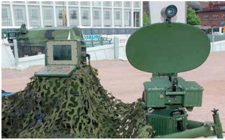
Das in Deutschland konstruierte und gebaute Nahbereichsradar BOR-A 550, wie es die griechische Küstenwache einsetzt

hat seit 2005 zwei fast neuwertige Systeme dieses Typs aus Beständen der Bundeswehr erhalten. Bis heute hält die türkische Armee Afrin besetzt. Seit Beginn der Intervention sind nach Angaben der Vereinten Nationen und von Hilfsorganisationen mehrere Hunderttausend überwiegend kurdische Menschen aus Afrin geflohen. Sie leben heute als Binnenflüchtlinge in anderen Teilen Syriens oder im Ausland. In Afrin wurden dagegen mit türkischer Unterstützung andere Bevölkerungsgruppen angesiedelt, zum Beispiel Turkmenen und sunnitisch-arabische Syrer.