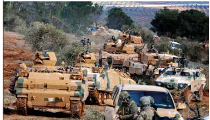
Türkische Truppen besetzen den Bursayah-Hügel, der die kurdische Enklave Afrin von der türkisch kontrollierten Stadt Azaz trennt

Nicht ausgeschlossen werden kann, dass weitere Rüstungsgüter deutschen Ursprungs bei dieser Intervention zum Einsatz kamen. So wäre es unter militärischen Gesichtspunkten durchaus sinnvoll gewesen, wenn die türkische Armee den Vormarsch ihrer Interventionstruppen mit dem deutsch-französischen Artillerieortungsradar Cobra unterstützt hätte, um einen Beschuss ihrer Truppen mit Mörsern rasch und effektiv unterbinden zu können. Die Türkei