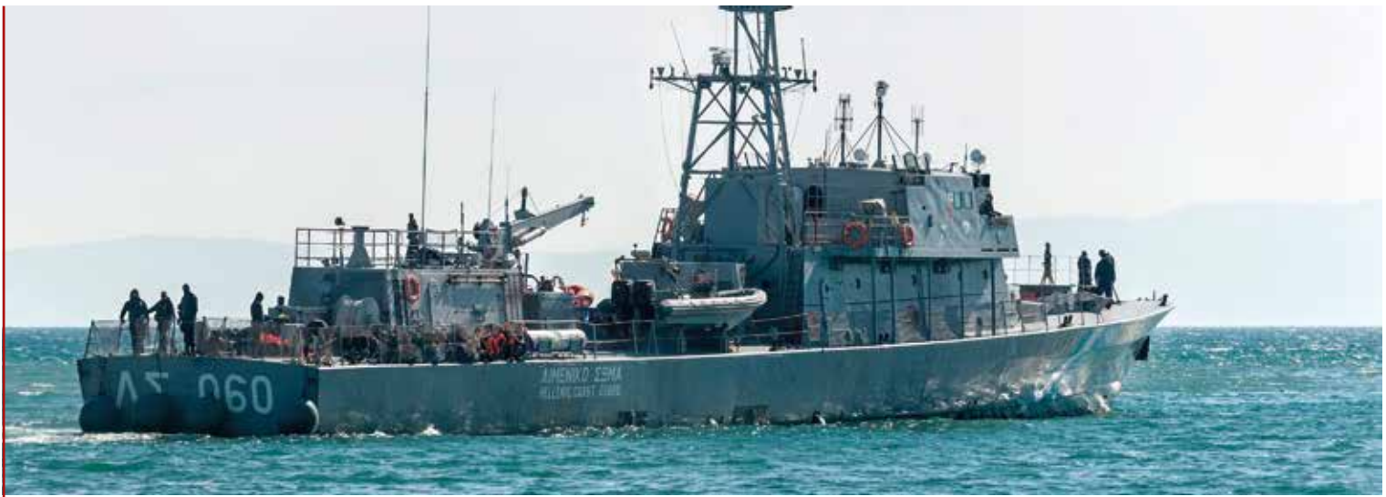
Bewaffnetes FRONTEX-Schiff während der Operation Hera im Jahr 2016

Am 18. Mai 2015 beschloss die EU erstmals einen Militäreinsatz, um Fluchtbewegungen über das Mittelmeer zu verhindern. Der Einsatz EUNAVFOR MED begann im Juni 2015 und wurde im Oktober 2015 in »Operation SOPHIA« umbenannt. Das Mandat erstreckt sich auf das Entern, die Beschlagnahmung und die Zerstörung von Booten, die für den illegalen Menschenhandel genutzt werden. Verdächtige Boote dürfen bereits in den libyschen Küstengewässern aufgebracht werden. Seit September 2016 umfasst das Mandat außerdem die Ausbildung und den Aufbau der libyschen Küstenwache und Marine. Die Rettung von Geflüchteten aus Seenot gehört dagegen nicht zum Auftrag. Die Bergung der etwa 50.000 Menschen im Operationszeitraum erfolgte ausschließlich auf Grundlage der völkerrechtlichen Pflichten des Internationalen Seerechts. Auch die Bundeswehr hat sich seit Beginn an diesem Einsatz beteiligt: Bis März 2019 waren insgesamt zumindest zeitweise acht Fregatten und drei Unterstützungsschiffe der Bundesmarine Teil des Militäreinsatzes. Nach Angaben der Bundesregierung wurde sogar die Bundeswehrspezialeinheit für verdeckte bewaffnete Einsätze, das Kommando Spezialkräfte der Marine, zeitweise aktiviert. Im März 2019 hat die EU das Mandat für die Operation verlängert, diese aber gleichzeitig für sechs Monate ausgesetzt.