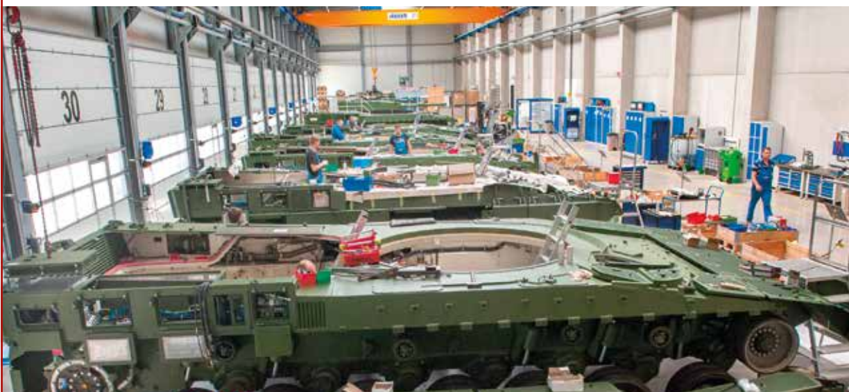
Produktionsstätte des Schützenpanzers Puma der Firma Rheinmetall in Unterlüß, Niedersachsen

Die Europäisierung des Grenzmanagements und der Flüchtlingsabwehr und insbesondere die Bereitschaft zur gemeinschaftlichen Finanzierung von Beschaffungsvorhaben hat das Interesse der (deutschen) Rüstungsunternehmen geweckt. Sie hoffen, bereits eingeführte militärische Systeme und Geräte (z. B.