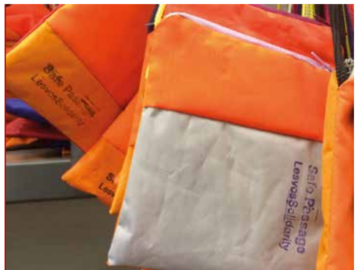
Taschen aus Rettungswesten: Upcycling-Workshop im Mosaik-Center. Zu beziehen über www.lesvossolidarityshop.org

CPT bemüht sich um Inklusivität, Ökumenizität und Diversität als Zeichen der Liebe Gottes in Gemeinschaften. Krieg und Unterdrückung können durch die Kraft der Gewaltfreiheit, durch Partnerschaften mit lokalen Friedensstiftern und mutiges und kreatives Handeln verwandelt werden. Das Motto von CPT ist: »Partnerschaften bilden, um Gewalt und Unterdrückung zu transformieren«. Die Teams verzichten deswegen auf missionarische Tätigkeit und arbeiten kollegial mit muslimischen, jüdischen und säkularen Gruppen zusammen.