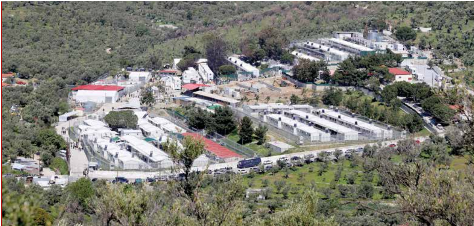
Flüchtlingslager nahe Moria auf der Insel Lesbos

Grenzschutzkomponenten zur Unterbindung »illegaler Migration« ergänzt, wie z. B. bei EUCAP Niger (2012) und EUCAP Mali (2014).