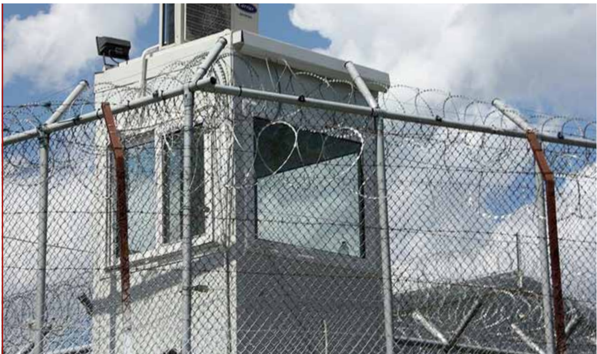
Moria-Zaun: Im Hotspot Moria werden ankommende Geflüchtete bis zu 28 Tagen festgehalten

Im aktuellen Internal Security Fund (2014–2020) sind für Griechenland etwa 245 Millionen Euro für Grenzschutzmaßnahmen eingeplant. Zudem wurden bis