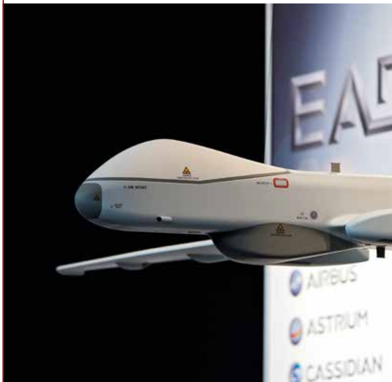
Aufklärungsdrohne der EADS-Tochtergesellschaft CASSIDIAN aus dem bayerischen Unterschleißheim nahe München

In diesem Schnittstellenbereich geht es um die Automatisierung der Aufklärungs- und Überwachungstechnik, um unwegsame Grenzgebiete erreichen zu können und dabei eine ständige Einsatzfähigkeit (24/7) zu gewährleisten. Dieser Bereich ist für die Rüstungsindustrie mit Abstand der interessanteste Forschungs- und Entwicklungsbereich. Denn auch und vor allem im militärischen Kerngeschäft spielen die Automatisierung und Miniaturisierung von Waffensystemen eine immer wichtigere Rolle. Daher sind die Rüstungskonzerne sehr daran interessiert, in diesem Technologiesegment den Rückstand zu den führenden Drohnenherstellern in den USA und Israel aufzuholen und nicht mehr länger als Juniorpartner agieren zu müssen.