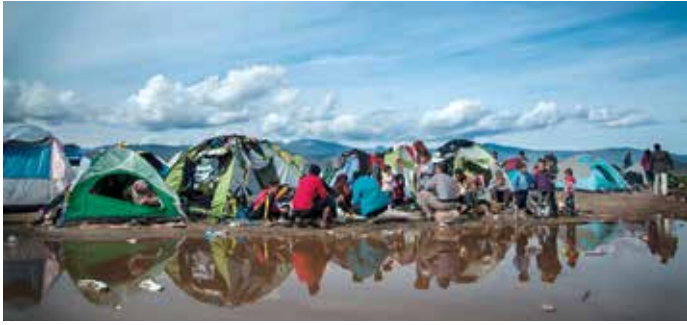
Geflüchtete warten nach ihrer Überfahrt nach Griechenland in Idomeni darauf, die Grenze nach Mazedonien zu überqueren

Abkommens veröffentlicht. Die Vereinbarung entspricht in ihrer Form eher einer Presseerklärung als einem internationalen Abkommen und baut auf vorangegangene, wenig wirksame Rückübernahmeabkommen zwischen der Türkei und der EU auf. Wichtigstes Ziel des Abkommens ist die deutliche Reduzierung von Zuwanderungszahlen. Die türkische Regierung verspricht ihre Grenzüberwachung auszubauen, um Migrantinnen und Migranten an der Grenzüberquerung zu hindern und vermehrt gegen Schlepper-Netzwerke vorzugehen. Die Menschen, die es trotz verschärfter Kontrollen auf die griechischen Inseln schaffen, sollen laut Abkommen nach einem Asylschnellverfahren in die Türkei zurückgeschoben werden. Im Gegenzug verspricht die EU, bis zu 72.000 syrische Staatsbürgerinnen und Staatsbürger aus der Türkei in europäischen Mitgliedstaaten anzusiedeln. Im Rahmen dieses 1:1-Tauschmechanismus soll für jede Person syrischer Staatsbürgerschaft, die in die Türkei abgeschoben wird, eine Syrerin oder ein Syrer in Europa angesiedelt werden. Zusätzlich werden der Türkei Erleichterungen bei der Vergabe von Schengen-Visa an türkische Staatsbürgerinnen und Staatsbürger sowie 6 Milliarden Euro für den Ausbau der Grenzkontrollen und die Versorgung von Geflüchteten versprochen. Außerdem hat man zugesichert, die EU-Beitrittsverhandlungen mit der Türkei wieder aufzunehmen.