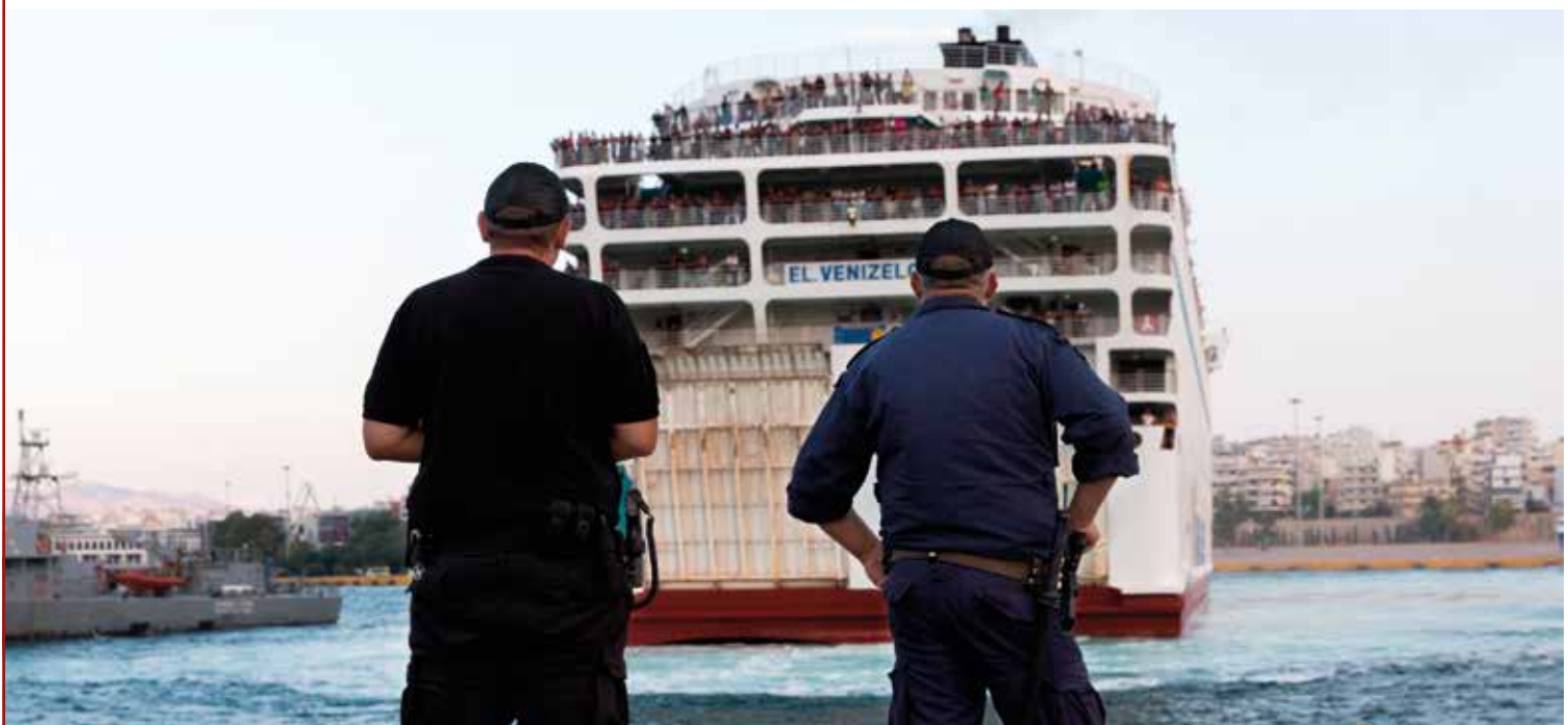
September 2015: Von den Inseln aufs griechische Festland. Noch ist der Weg über die Balkanroute offen.

FRONTEX – seit 2016 offiziell umbenannt in »European Border and Coast Guard Agency« (EBCG) – hat die Fluchtbewegungen Richtung Europa als Argument für den weiteren Ressourcen- und Aufgabenzuwachs genutzt: Zwischen 2006 und 2017 erhöhte sich das Budget von 19,2 auf 280,5 Millionen Euro, das Personal wuchs von 45 auf 541 Personen an. Ende März 2019 beschloss die EU-Kommission die Aufstockung des laufenden Budgets auf insgesamt 1,3 Milliarden Euro 2019/2020. Im darauf folgenden Planungszeitraum (2021–2027) sollen im EU-Finanzrahmenplan insgesamt 11,3 Milliarden Euro für FRONTEX bereitgestellt werden, und die Personalstärke soll auf 1.500 Personen erhöht werden. Außerdem ist geplant, den Personalpool für Interventionseinsätze an den Außengrenzen (inkl. Drittstaaten) – sogenannte Rapid Border Intervention Teams (RABIT) – aufzustocken. Als Teil der »Reliable Intervention Force« sollen 7.000 Grenzbeamte für kurzfristige Einsätze und 1.500 Grenzbeamte für längerfristige Maßnahmen mobilisiert werden können.