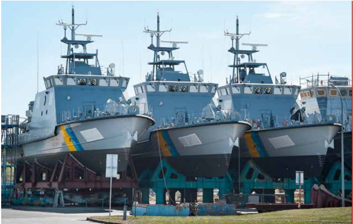
Patrouillenboote für Saudi-Arabien in der zur Lürssen-Werftengruppe gehörenden Peene-Werft

Aufgrund der Bandbreite an verfügbaren Inhouse-Kapazitäten und der Protegierung durch die französische und deutsche Regierung konnte der Rüstungskonzern einige Großaufträge zum Aufbau nationaler Grenzüberwachungssysteme gewinnen. Das erste Großvorhaben war der Aufbau des Integrated System for Border Security (ISBS) für Rumänien zwischen 2004–2011 mit einem geschätzten Gesamtvolumen von 600–650 Millionen Euro. Der deutsche Rüstungskonzern übernahm die Koordination des Vorhabens und lieferte darüber hinaus das TETRA-System für die Kommunikation zwischen verschiedenen Sicherheitsorganen sowie ein radargestütztes Küstenüberwachungssystem. Einige Teile des Vorhabens wurden aus dem PHARE-Programm und der Schengen Facility II der EU finanziert. Daneben waren die einzelnen Konzernsparten und Tochterunternehmen an weiteren Grenzschutzprogrammen beteiligt. Die 2011 durch die Zusammenlegung der Sofrelog S.A.S. und Atlas Maritime Security GmbH gegründete Signalis GmbH war sowohl für die spanische Guardia Civil auf den Kanarischen und Balearischen Inseln als auch für Bulgarien am Aufbau von Küstenüberwachungssystemen beteiligt.